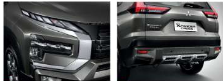
17inch Alloy Wheel Design